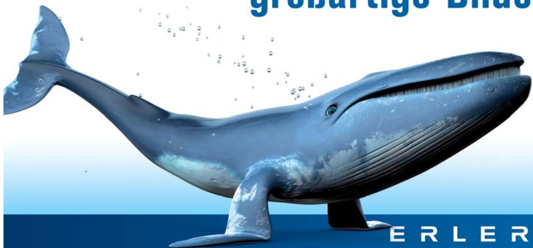
Abb_3: Erstklassige Lesbarkeit aus weiter Ferne: großformatiger Plott.

≡ Wir fertigen von Ihren Daten großartige Bilder!