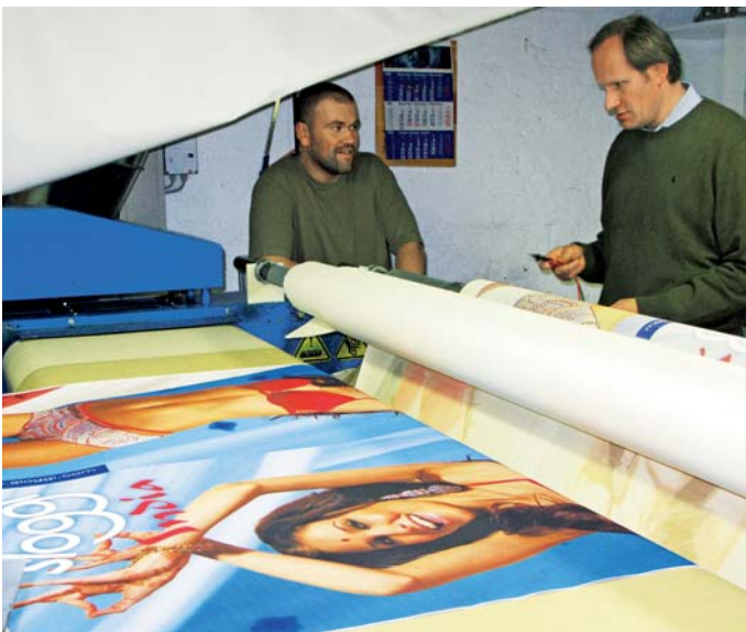
Abb_1: Qualitätskontrolle während der Produktion.

Der Druckdienstleister Erler & Pless aus Hamburg hat sich mit Top-Qualität einen Namen gemacht und beliefert Kunden in aller Welt. Das setzt betriebswirtschaftlichen Durchblick voraus. Den verschafft sich das Unternehmen mit Software von HS.